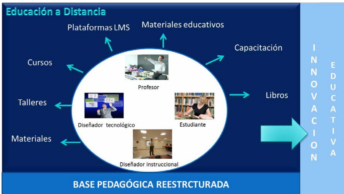
Figura 1. “La innovación educativa en la educación a distancia”

La innovación en educación es un proceso que tiene diferentes aspectos siempre orientados a una transformación de asumida por los figuras o agentes de cambio. La innovación se conceptualiza como un cambio o mejora del sistema educativo para alentar el crecimiento personal e institucional (Barraza, 2007).