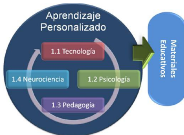
Figura 3. "Modelo CAEE"