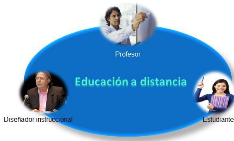
Figura 2. “Los roles de la educación a distancia”

Materiales educativos , Gimeneo 1991 lo definen como cualquier instrumento u objeto que pueda servir como recurso, ya que a través de la manipulación, observación o lectura se ofrezcan oportunidades de aprendizaje; es por ello que los materiales didácticos apoyados en los recursos tecnológicos ilustrativos.