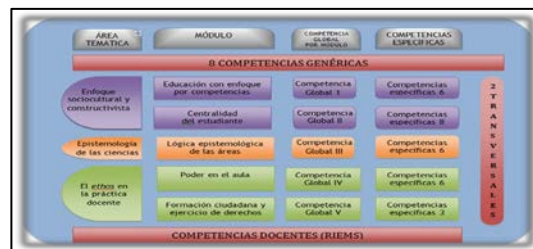
Figura 1. Esquema curricular del diplomado

Módulo 5: La formación ciudadana de los bachilleres y el ejercicio de sus derechos en los establecimientos escolares.