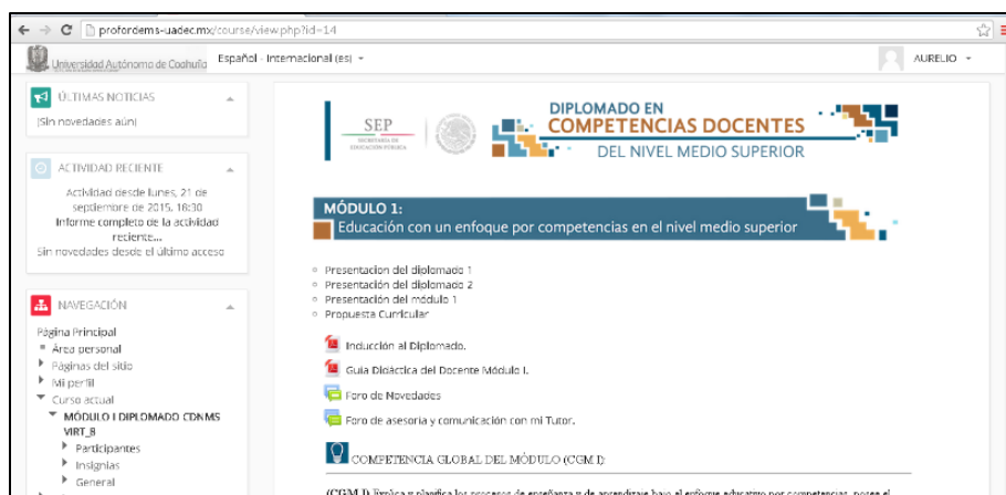
Figura 3. Parte de la estructura del diplomado en línea

En referencia a las responsabilidades de los tutores fueron las siguientes: