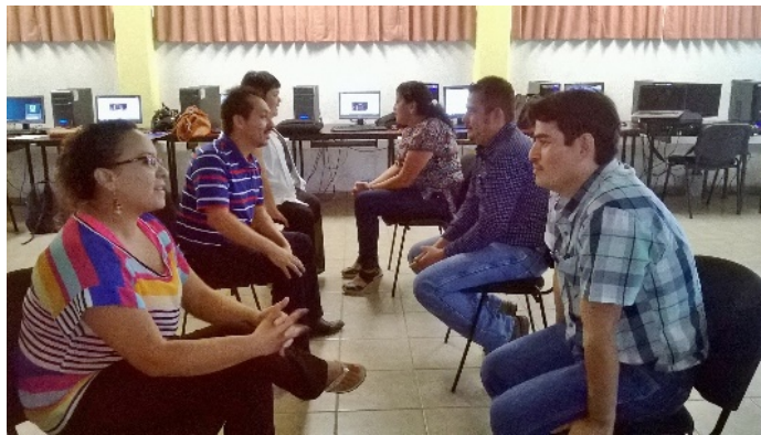
Figura 6. Sesión presencial en Monclova, Coahuila