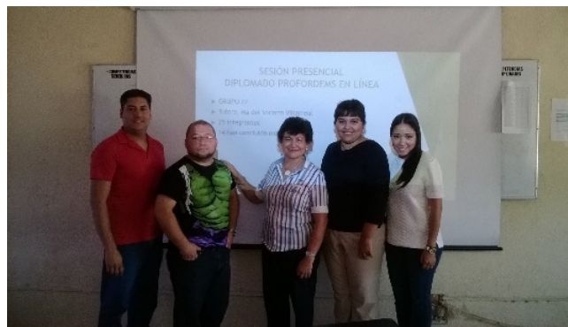
Figura 7. Sesión presencial en Piedras Negras, Coahuila