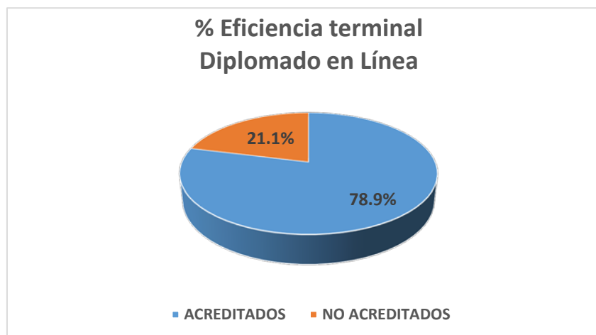
Figura 9. Eficiencia terminal del diplomado en línea